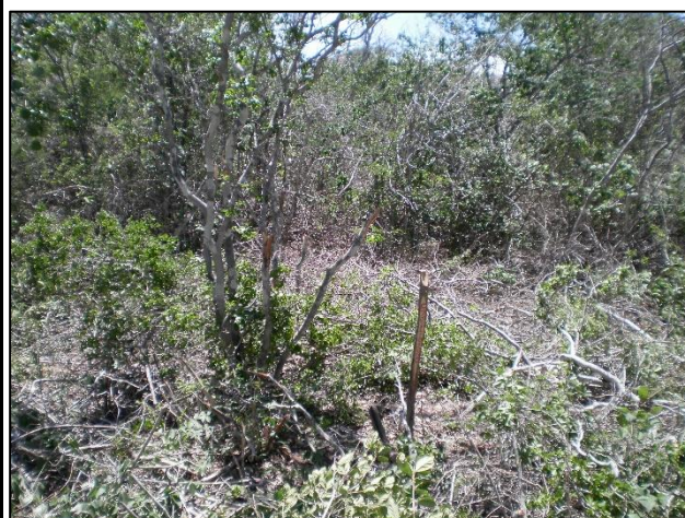
Legendas: Foto 1 - Vista do empilhamento da madeira